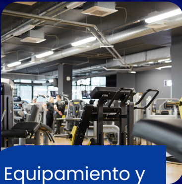
Equipamiento y accesorios

Beneficios exclusivos, marcas aliadas y recursos estratégicos para impulsar el crecimiento del fitness y fortalecer a nuestros afiliados.