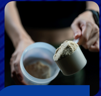
Suplementación y alimentación